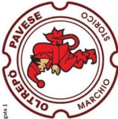
Presentazione marchio e sue applicazioni